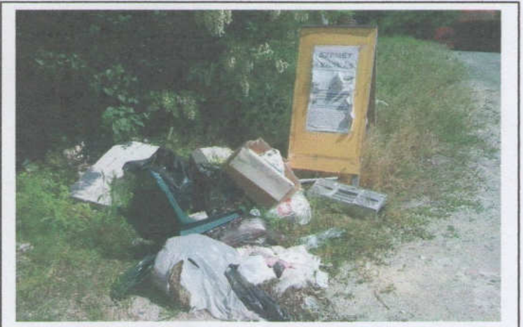
Hiába a tiltás, mindig akad, illegálisan rak le szemetet

Megoldást alighanem az hozhat, ha a térfigyelő rendszert ilyen célra is bevetjük majd.