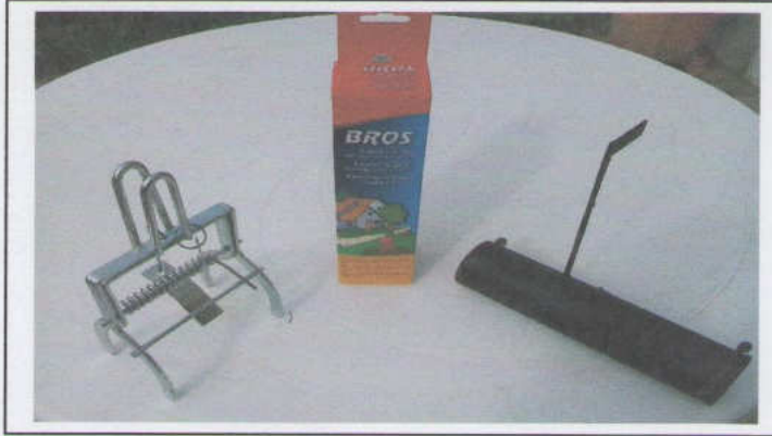
Balra egy drasztikus, jobbra egy humánusabb fegyver a vakond ellen

gyaszt, egyebek közt például lótetűt, ami miatt hasznos, viszont a fő csemegéje a földigiliszta, amiért viszont kifejezetten káros. Ha tehát fertőtleníti a kert talaját, elvándorol, viszont egyben tönkreteszük a talajt.