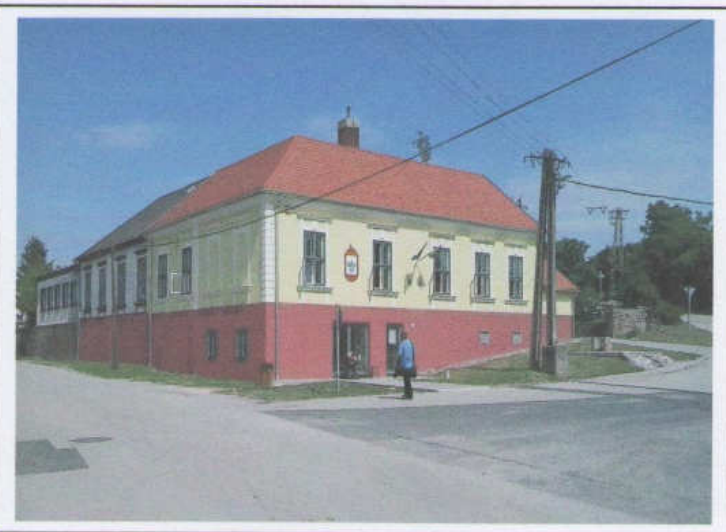
Kívül-belül megújult a hajdani iskolaépület a közös hivatal fogadására

A település ezután központi, úgynevezett „kijelölő döntéssel” került áprilistól tízediként az így már összességében több mint négyezer fő ügyeit intéző Kővágóörsi Közös Önkormányzati Hivatalhoz.